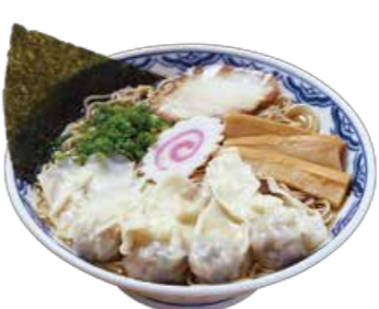
わんたん中華そば 850

豚骨から取る濁りの無い特製清湯スープ。飛魚アゴの香ばしい香り漂う由丸の美味「中華そば」