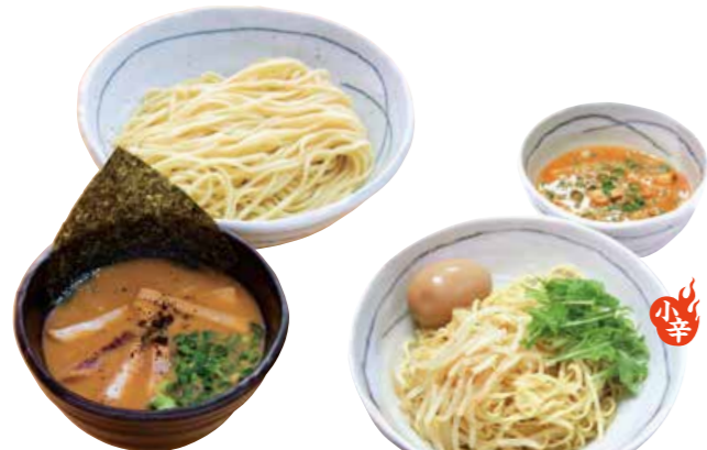
濃厚魚介つけ麺 850 魚介だしのスープに10種類以上のスパイスを効かせました