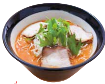
とんこつ担々麺 920 自家製ラー油の辛味がクセになるやみつき担々麺(ピーナツバター使用)