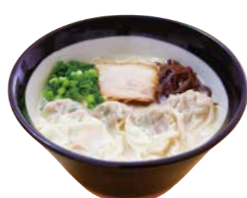
わんたん麺 850 たっぷりのふりっふりわんたんが大好評