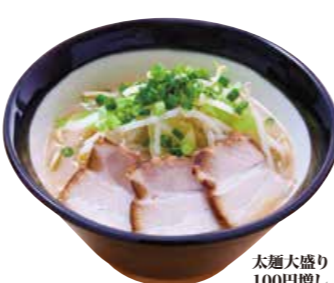
麦味噌らーめん 850 鹿児島麦味噌を使った濃厚なスープとそれに負けない太麺で