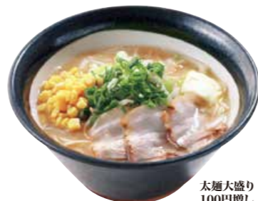
味噌バターコーン麺 1050 自慢の麦味噌にコーンがたっぷり