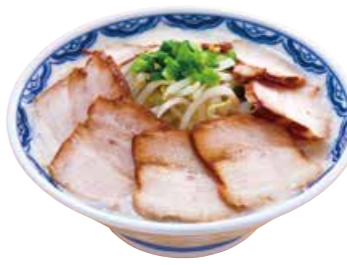
塩もやしチャーシュー麺 1000 たっぷりもやしにボリューム満点のチャーシューをのせました