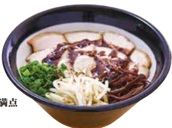
黒チャーシュー麺 1000 こってりスープとたっぷりチャーシューのボリュームが満点