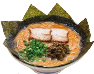
からか麺 920 とんこつスープと柚子胡椒の新しい味わいをおためしください