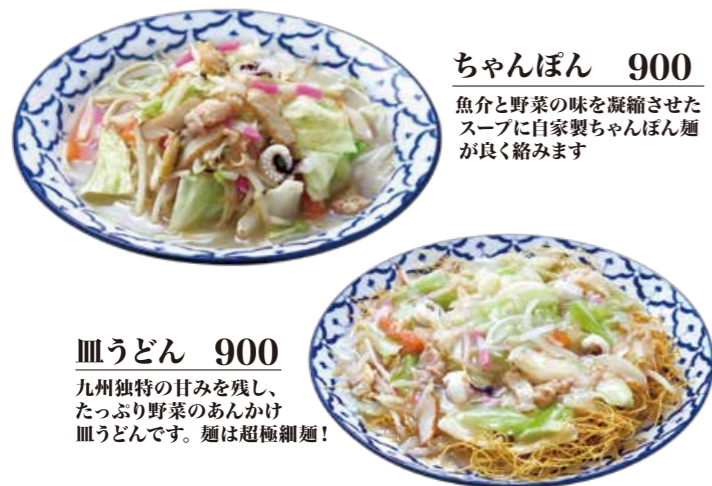
ちゃんぽん 900 魚介と野菜の味を凝縮させたスープに自家製ちゃんぽん麺が良く絡みます