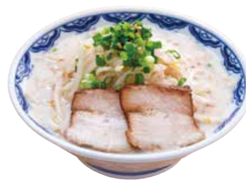
塩もやしらーめん 800 たっぷりもやしとニンニク風味の塩とんこつ