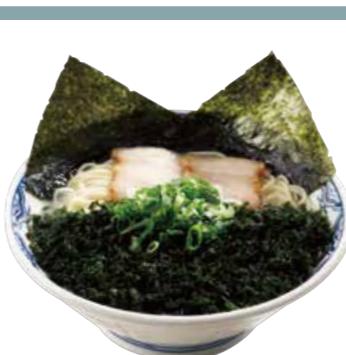
塩岩磯のりらーめん 900 岩磯のりがスープの旨味を引き立てます