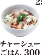
チャーシューごはん 300