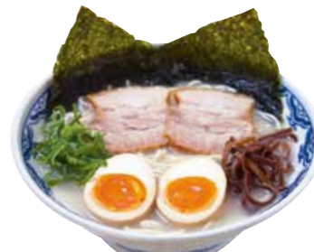
由丸らーめん 830 味玉とのりが入ったイチオシのらーめん