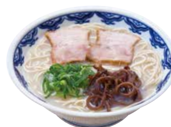
博多らーめん 700 由丸の原点。8時間かけて炊きだした本格博多らーめん