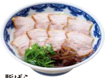
豚ばらチャーシュー麺 900 肉の旨味を閉じ込めた豚バラ肉のチャーシューをたっぷりのせました