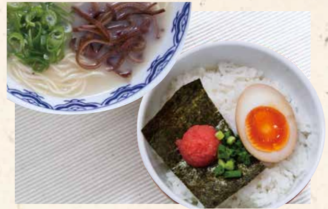
鳕鱼籽卤蛋饭+博多拉面 明太味玉ごはんセット 880