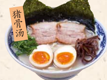
猪骨汤 由丸拉面 由丸らーめん 850 由丸の新定番。人気のトッピング2品入り