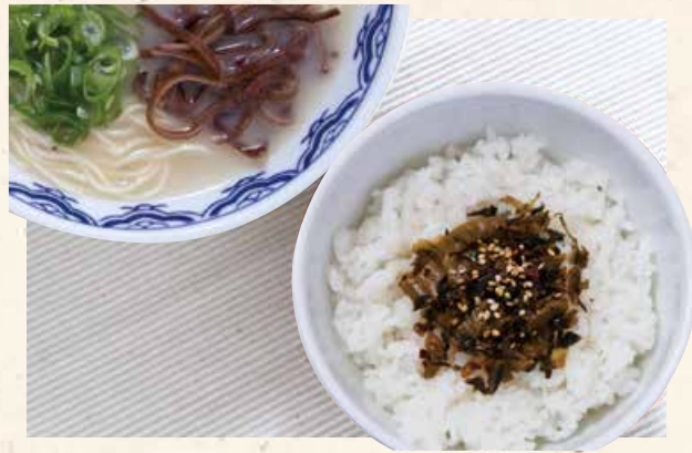
高菜饭+博多拉面 高菜ごはんセット 800