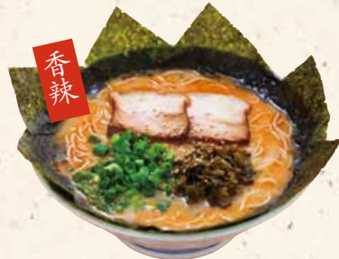
香辣 猪骨汤拉面 からか麵 920 (柚子胡椒) とんこつスープと柚子胡椒の新しい味をお試しください