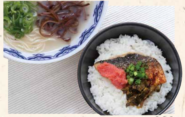
烤青鱼鳕鱼籽饭+博多拉面 焼きサバ明太ごはんセット 900