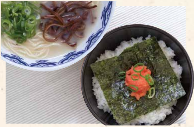
鳕鱼籽饭+博多拉面 明太子ごはんセット 850