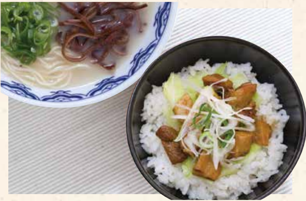
叉烧饭+博多拉面 チャーシューごはんセット 900