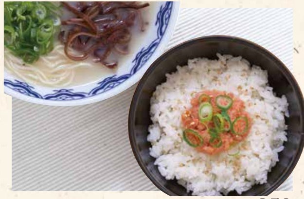
鲑鱼鳕鱼籽饭+博多拉面 鮭明太ごはんセット 850