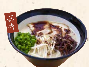
蒜香 黑拉面 黒らーめん 800 熊本の定番のマー油がかかった絶品スープ