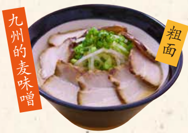
九州の麦味噌 麦味噌叉烧面 麦味噌チャーシュー麵 1020 自慢の麦味噌に野菜とチャーシューがたっぷり