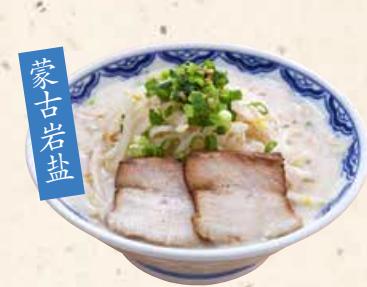
蒙古岩盐 豆芽拉面(咸味) 塩もやしらーめん 800 たっぷりもやしとにんにく風味の塩とんこつ