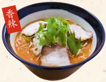
香辣 猪骨汤担担面 とんこつ 担々麵 920 自家製ラー油の辛味がクセになる担々麵