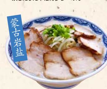
蒙古岩盐 豆芽叉烧面(咸味) 塩もやしチャーシュー麵 1000 たっぷりもやしとたっぷり叉焼のボリューム満点