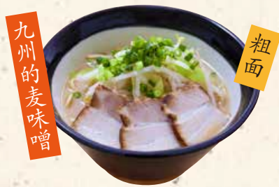
九州の麦味噌 麦味噌拉面 麦味噌らーめん 850 鹿児島麦味噌を使った濃厚なスープとそれに負けない太麺で