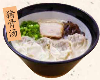
猪骨汤 馄饨面 わんたん麵 850 プリプリのわんたんが評判