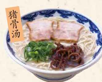
猪骨汤 博多拉面 博多らーめん 700 由丸の原点。スープは8時間かけて炊きだした本格博多らーめん