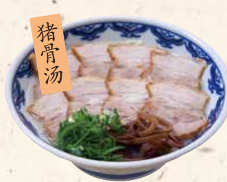
猪骨汤 五花肉叉烧面 豚ばら チャーシュー麵 900 肉の旨味を閉じ込めた豚バラ肉のチャーシューをたっぷりのせました