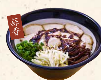
蒜香 黑叉烧面 黒チャーシュー麵 1000 マー油のスープとチャーシューがボリューム満点